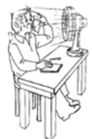
Evaporación del Sudor

La excesiva sudoración, provoca la pérdida de sales y agua en nuestro organismo, que se traducen en sensación de sed, malestar y disminución de la atención, aumentando así la probabilidad de que ocurran accidentes de trabajo.